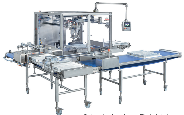
Optional: mit weiteren Förderbändern